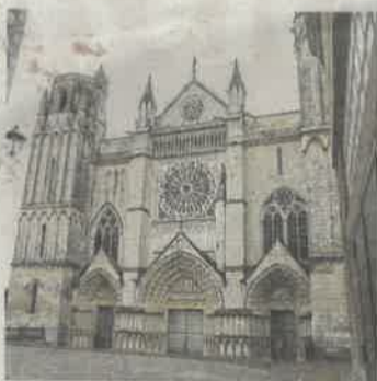
La cathédrale de Poitiers ouvre sa salle du chapitre au public.

Au Moyen Âge, Mirebeau, place forte des Ducs d'Anjou, blottie aux pieds de sa forte-