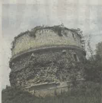
La tour casematée de Monthoiron est attribuée à Léonard de Vinci.