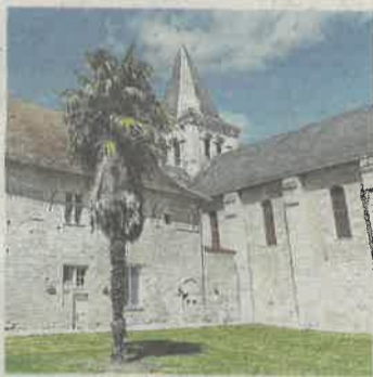
Le cloître du Prieuré Saint-André, à Mirebeau, sera exceptionnellement ouvert.

L'église Saint-Nicolas de Civray, datée du 12 e siècle, est un joyau de l'art roman qui participe pour la première fois aux Journées du patrimoine. Sa façade rectangulaire comporte une profusion de sculptures dont les étonnantes Vierges sages et Vierges folles et, plus rare, l'Assomption de la Vierge. À l'intérieur, elle s'orne d'une fresque qui conte la légende de saint Gilles. À l'extérieur, elle arbore une tour-lanterne octogonale sur le chevet.